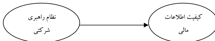
شکل شماره ۱: الگوی علی پارامترهای پژوهش

ضمن، بین متغیرهای کنترلی (اندازه موسسه حسابرسی، اندازه شرکت و سن شرکت) و کیفیت اطلاعات مالی نیز ارتباطی وجود ندارد. به نظر می‌رسد شاید دلیل رد فرضیه‌های پژوهش مذکور استفاده از الگوهایی است که به جای اندازه‌گیری مستقیم کیفیت اطلاعات مالی، بیشتر جنبه کیفیت سود و اقلام تعهدی را مورد بررسی قرار می‌دهند. همانطور که ذکر شد، فتی (۲۰۱۳) نیز تنها از کیفیت اقلام تعهدی برای اندازه‌گیری کیفیت اطلاعات مالی استفاده نموده است. لذا، در پژوهش حاضر از ویژگی‌های کیفی اطلاعات مطرح شده در چارچوب نظری گزارشگری مالی که مورد استناد بیشتر مجامع حرفه‌ای است، استفاده گردیده است (شکل شماره ۱).