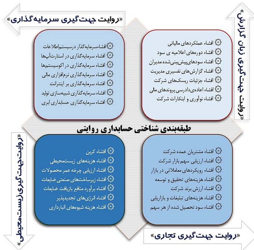
شکل ۴. طبقه‌بندی شناختی حسابداری روایتی در بستر شرکت‌های بازار سرمایه