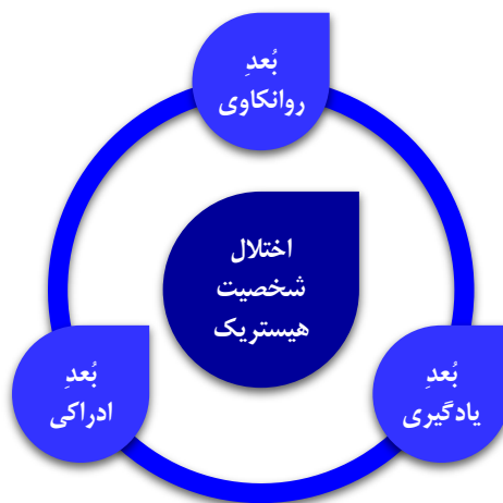
شکل ۲. اختلال شخصیتی هیستریک (نمایشی) در مناصب مدیریتی (منبع: اسمیت و لینینفیلد، ۲۰۱۲ )

فارل و شاو (۱۹۹۴) اختلال شخصیت هیستریک را مطرح نمودند. اختلال شخصیت هیستریک یا نمایشی نوعی رفتار تعمودی در فرد برای دیده شدن است که می‌تواند در لایه‌های پنهان خود پوششی برای رفع کاستی‌های عملکردی نیز تلقی گردد. این اختلال شخصیت، از گروه‌های اختلالات خوشه‌ی B یا هیجانی است که به دلیل سرخوردگی‌های عاطفی و اجتماعی، سطحی از ناپایداری را تجربه می‌کنند که همواره در تلاش هستند تا با ارائه‌ی رفتارهایی مورد توجه در تصمیم‌گیری‌های خود، مورد احترام واقع شوند و با نمایش اعتماد بنفس این افراد همواره در تلاش برای پوشش ضعف در عزت نفس خود هستند. وجود این اختلال در مدیران اما می‌تواند بدلیل ترکیب با رویه‌های اقناع‌گری در رفتار از شدت بیشتری در ایفای نقش‌های نمایشی برخوردار باشد و مجموعه‌ای از رفتارهای غیرعادی که الزاماً در ظاهر مطلوب بنظر می‌رسند را به نمایش در می‌آورند. معمولاً در سایه روشن بی‌ثباتی رفتاری، به دنبال نمایش مطلوب از عملکردهای خود هستند و به راحتی می‌توانند منافع خود را به طور پنهانی دنبال نمایند. یکی از ویژگی این افراد مهارت‌های اجتماعی بالا در برقراری ارتباط با دیگران است که همواره تلاش می‌کنند تا در مرکز توجه قرار بگیرند. این خصیصه‌ی شخصیت در مدیران به ویژه در زمانی که تثبیت جایگاه تصدی مدیریت بسته به رضایت ذینفعان یا اعضای هیئت مدیره است، احتمالاً بیشتر بروز خواهد کرد. اسمیت و لینینفیلد (۲۰۱۲) ویژگی‌های اختلال شخصیتی هیستریک (نمایشی) را در مناصبی همچون مدیریت را در سه بخش از نظر ایفای آن به تفکیک ارائه داده است.