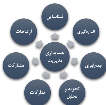
شکل ۱. رویکرد حسابداری مدیریت

همانطور که در شکل ۱ مشاهده می‌شود، این انجمن، حسابداری مدیریت را گزینه‌ای از تکنیک‌ها و مراحل حسابداری برای جمع‌آوری داده جهت گزارشگری مالی؛ تولید و توزیع داده‌ها به منظور برآوردن نیازهای اطلاعاتی مدیریت تعریف می‌کند. همچنین در تعریفی دیگر انجمن ملی حسابداران آمریکا، حسابداری مدیریت را فرآیندی مبتنی بر تشخیص؛ اندازه‌گیری؛ تجمیع؛ تجزیه و تحلیل؛ تهیه و تفسیر و ارائه اطلاعات مالی مورد استفاده مدیریت به منظور برنامه‌ریزی، ارزیابی و کنترل عملیات یک سازمان معرفی می‌کند. فدراسیون بین‌المللی حسابداران ۱ (IFAC) در فوریه ۱۹۸۹ طی «بیانیه مفاهیم حسابداری مدیریت» حسابداری مدیریت را به عنوان بخشی از فرایند مدیریت شناسایی می‌کند که برای مدیران در امر برنامه‌ریزی و کنترل، اطلاعات فراهم می‌کند. از این رو چارچوب مفهومی آن بر ویژگی‌هایی که باید این اطلاعات به «عنوان مبنایی که شیوه‌ها و تکنیک‌های حسابداری مدیریت بر اساس آن‌ها آزمون شوند» تمرکز دارد. بنابراین، حسابداری مدیریت به عنوان بخشی از فرآیند مدیریت است که اطلاعات لازم را برای موارد زیر تهیه می‌کند: (ابراهیمی کهریزسنگی و بخردی‌نسب، ۱۳۹۸)