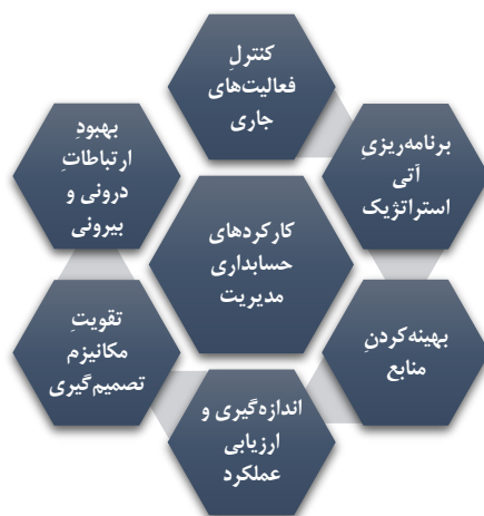
شکل ۲. فرآیند مدیریتی حسابداری مدیریت

همانطور که در شکل ۱ مشاهده می‌شود، این انجمن، حسابداری مدیریت را گزینه‌ای از تکنیک‌ها و مراحل حسابداری برای جمع‌آوری داده جهت گزارشگری مالی؛ تولید و توزیع داده‌ها به منظور برآوردن نیازهای اطلاعاتی مدیریت تعریف می‌کند. همچنین در تعریفی دیگر انجمن ملی حسابداران آمریکا، حسابداری مدیریت را فرآیندی مبتنی بر تشخیص؛ اندازه‌گیری؛ تجمیع؛ تجزیه و تحلیل؛ تهیه و تفسیر و ارائه اطلاعات مالی مورد استفاده مدیریت به منظور برنامه‌ریزی، ارزیابی و کنترل عملیات یک سازمان معرفی می‌کند. فدراسیون بین‌المللی حسابداران ۱ (IFAC) در فوریه ۱۹۸۹ طی «بیانیه مفاهیم حسابداری مدیریت» حسابداری مدیریت را به عنوان بخشی از فرایند مدیریت شناسایی می‌کند که برای مدیران در امر برنامه‌ریزی و کنترل، اطلاعات فراهم می‌کند. از این رو چارچوب مفهومی آن بر ویژگی‌هایی که باید این اطلاعات به «عنوان مبنایی که شیوه‌ها و تکنیک‌های حسابداری مدیریت بر اساس آن‌ها آزمون شوند» تمرکز دارد. بنابراین، حسابداری مدیریت به عنوان بخشی از فرآیند مدیریت است که اطلاعات لازم را برای موارد زیر تهیه می‌کند: (ابراهیمی کهریزسنگی و بخردی‌نسب، ۱۳۹۸)