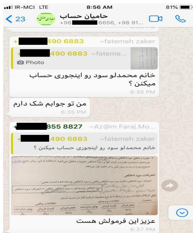
شکل ۱. نمونه حل تمرین مشارکتی در فضای مجازی